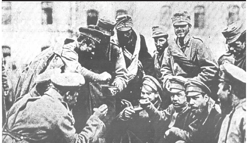
Soldats russes et autrichiens fraternisant sur le front en 1917

Lisez aussi notre presse sur Internet : http://www.geocities.com/Paris/6368/